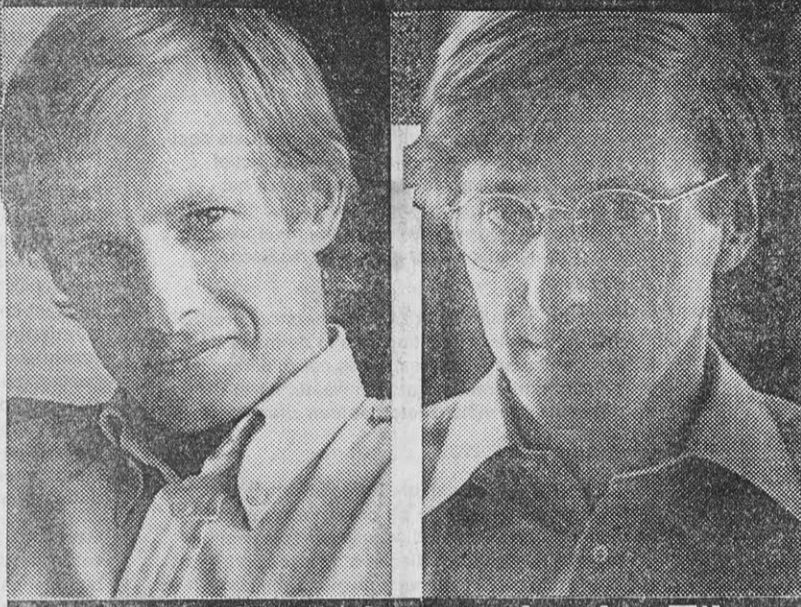
Nederlanders in het 'verboden Tibet'

"We praatten bijvoorbeeld met een lama, via een tweede tolk die van Tibetaans in Chinees vertaalde. De man hield een heel betoog over zijn klooster. Toen wij uiteindelijk de Engelse versie te horen kregen was die geslonken tot: "De monnik zegt dat dit beeld de Boeddha voorstelt." Die hadden we zelf ook al herkend."